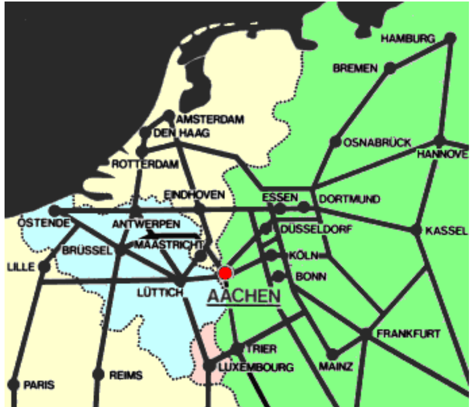
Anreise zur Stadt Aachen

Direkt am Dreiländereck Deutschland - Belgien - Niederlande hat hier europäisches Denken und Leben eine lange Tradition. Aachen liegt auch verkehrstechnisch günstig, an den europäischen Autobahn-Achsen nach Brüssel, Paris und Antwerpen. Auch per [Bahn] * erreichen Sie Aachen bequem. Die Flughäfen [Düsseldorf] *, [Mönchengladbach] *, [Köln] *, [Maastricht-Aachen] * und [Brüssel] * sind nur einen Sprung von Aachen entfernt.